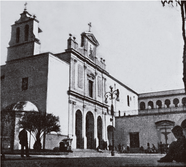
7. Afragola, santuario di S. Antonio e convento. Veduta da viale S. Antonio, anni Venti del secolo scorso.