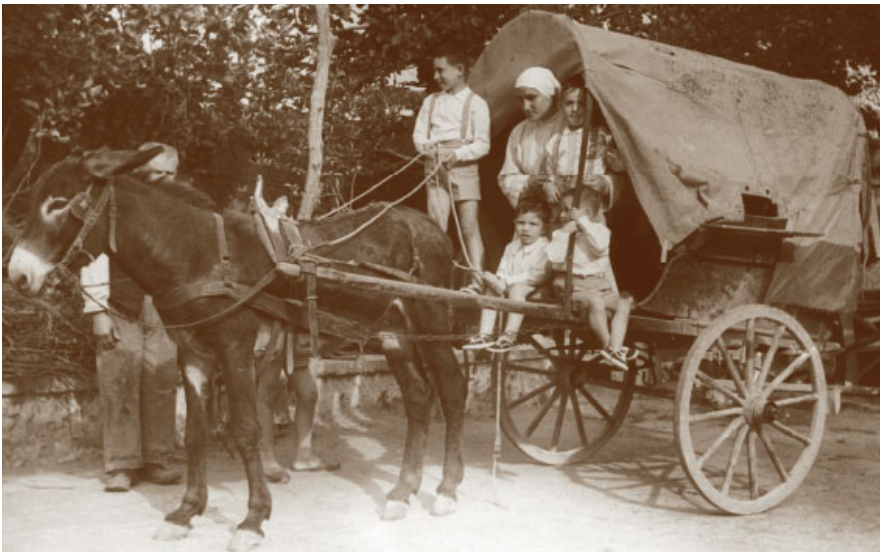
19. Una Piccola Ancella su un carro alla fine della seconda guerra mondiale durante la questua.