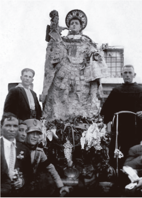
8. Afragola, statua di S. Antonio in processione, 1930.