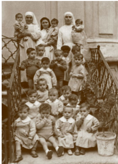
25. Napoli, S. Giuseppe dei Nudi, casa delle Piccole Ancelle di Cristo Re. Bambini assistiti nel nido dalle suore.