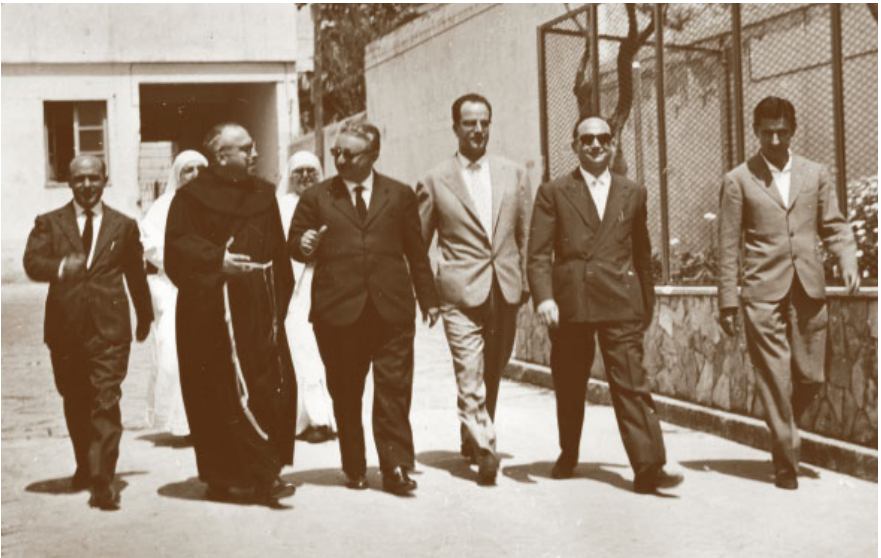
35. Portici, casa delle Piccole Ancelle di Cristo Re.