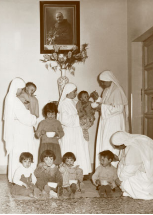
30. Napoli, S. Giuseppe dei Nudi, casa delle Piccole Ancelle di Cristo Re. Le suore accudiscono maternamente un gruppo di bambine ospiti del nido.