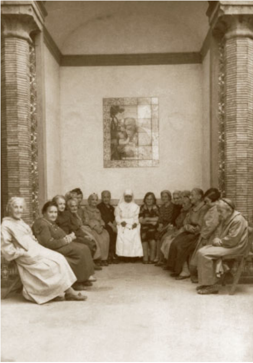
26. Napoli, S. Giuseppe dei Nudi, casa delle Piccole Ancelle di Cristo Re. Una suora accompagna le anziane ospiti nella recita del Rosario.