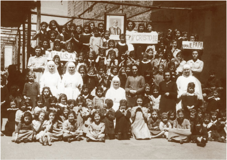
18. Torre Annunziata, casa delle Piccole Ancelle di Cristo Re. Colonia estiva del 1946.