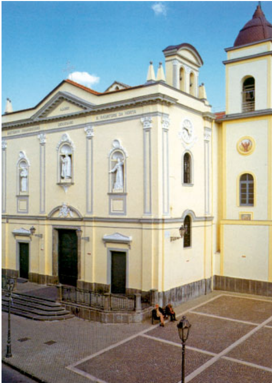
4. Orta di Atella, santuario diocesano di S. Salvatore da Horta, facciata.