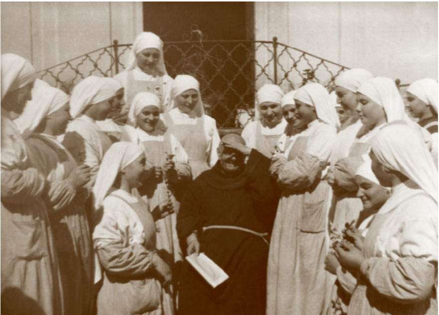
27. Napoli, S. Giuseppe dei Nudi, casa delle Piccole Ancelle di Cristo Re. Le suore strette intorno al fondatore (1950).