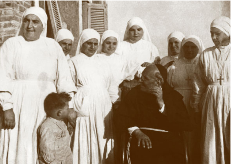
28. Portici, casa delle Piccole Ancelle di Cristo Re. I fondatori, alcune suore ed un bambino ospite della casa.