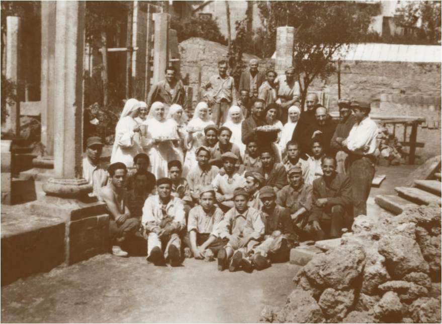
24. Napoli, S. Giuseppe dei Nudi, casa delle Piccole Ancelle di Cristo Re. Un momento di relax per i fondatori e gli operai durante i lavori di ristrutturazione dell'edificio.