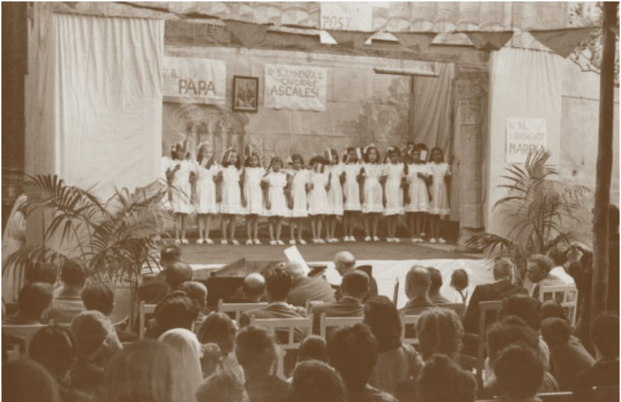
10. Torre Annunziata, casa delle Piccole Ancelle di Cristo Re. Padre Sosio Del Prete accompagna al pianoforte le bambine durante la visita del cardinale Alessio Ascalesi, arcivescovo di Napoli.