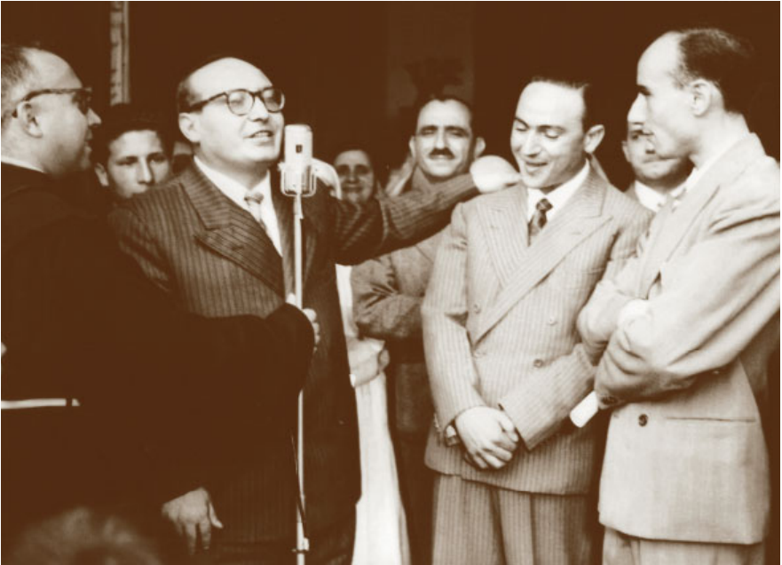
34. Portici, casa delle Piccole Ancelle di Cristo Re.