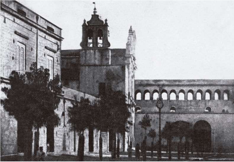
6. Afragola, santuario di S. Antonio e convento. Veduta da viale S. Antonio, inizio Novecento.