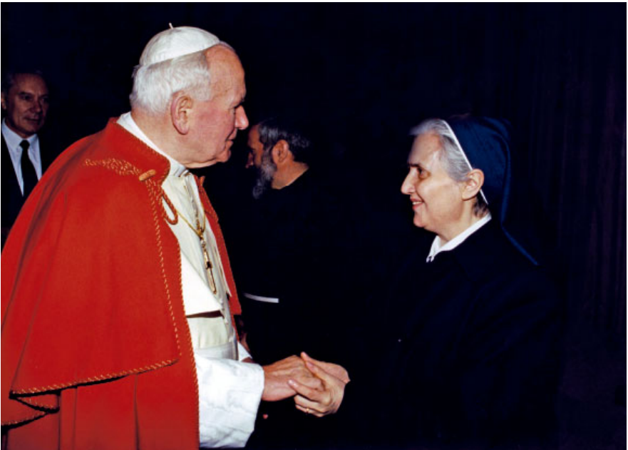
41. Giovanni Paolo II e suor Antonietta Tuccillo, attuale superiora generale delle Piccole Ancelle di Cristo Re.