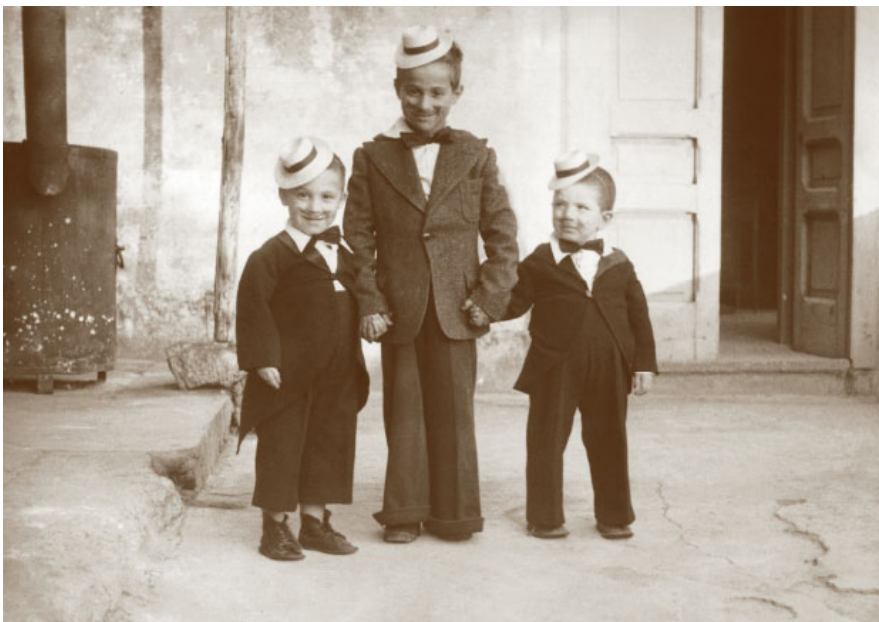
22. Boscoreale, casa delle Piccole Ancelle di Cristo Re. Tre orfanelli vestiti per la varietà conclusivo dell'annuale colonia estiva.