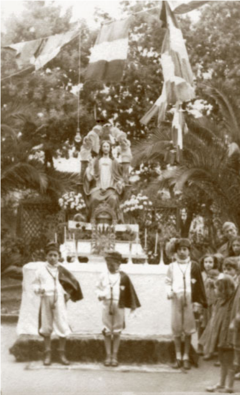
16. Torre Annunziata, casa delle Piccole Ancelle di Cristo Re. Festa di Cristo Re celebrata il 26 ottobre 1941.