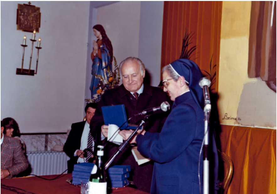
39. Frattamaggiore, casa delle Piccole Ancelle di Cristo Re. Il presidente Oscar Luigi Scalfaro e suor Antonietta Tuccillo in occasione del 50° anniversario di fondazione dell'istituto (1986).